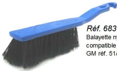
Réf. 683 Balayette nylon GM, bleue ou rouge, compatible avec notre pelle plastique GM réf. 51/C