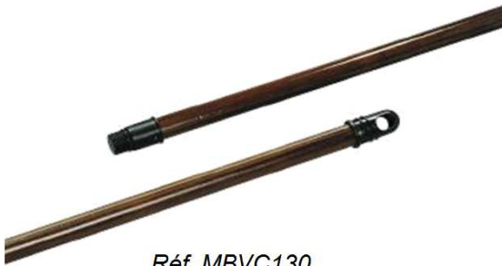
Réf. MBVC130 Manche merisier verni, avec vis et embout, diamètre 24mm, dimension : 1.25m, coloris teinté foncé