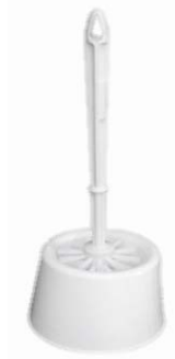
Réf. 95/E Combiné WC brosse boule + socle blanc Socle : diam=13cm/hauteur 9.5cm, longueur balayette=36cm