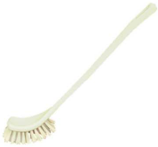
Réf. 952000 Brosse WC courbe en polypropylène, monture en plastique, 37cm.