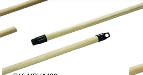
Réf. MBVA130 Manche en bois brut, avec vis et embout, diamètre : 24mm, longueur : 1.30m