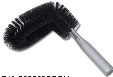
Réf. 000009SCOV Tête de loup brosse courbe

Tête de loup vinyle fleuré, forme champignon avec douille à vis, coloris noir