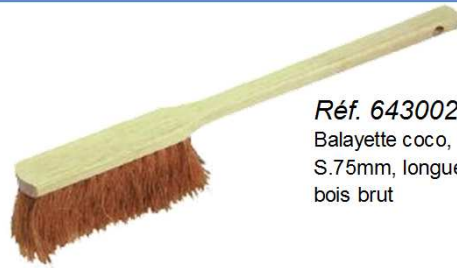
Réf. 643002 Balayette coco, long manche, S.75mm, longueur 45cm, monture en bois brut