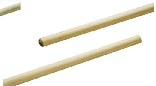
Réf. 151 Manche cantonnier en bois brut, diamètre : 28mm, longueur : 1.40m