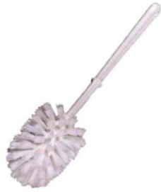
Réf. 019 Brosse WC boule polypropylène monture plastique, 36cm