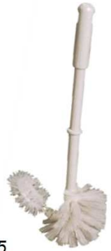
Réf. 1717005 Brosse WC boule spéciale, double fonction, Elastoflex, monture en plastique, dimension : 38cm