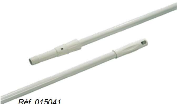
Réf. 015041 Manche télescopique acier, embout conique et à vis, dimension : 2x1m