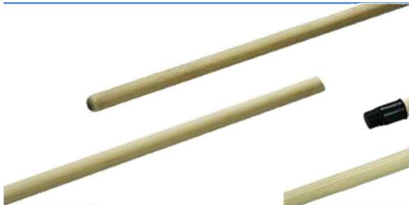
Réf. MB130 Manche bois naturel, diamètre : 24mm, longueur : 1.30m, sans douille, ni embout.