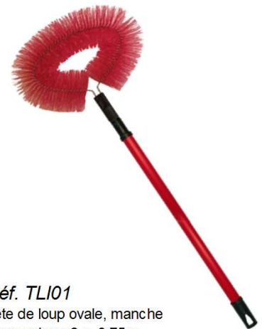
Réf. TLI01 Tête de loup ovale, manche télescopique 2 x 0.75m

Brosse radiateur vinyle forme coudée manche bleu Hauteur : 440mm. Diam 57mm. Poids 50g